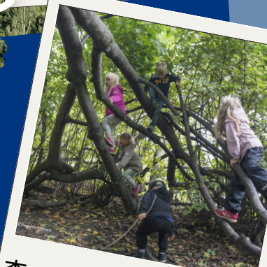
森の保育園・幼稚園

湖水地方の玄関口・Hämeenlinna (ハメーンリンナ) を中心に、フィンランドで暮らす人々の夏の暮らし方や教育環境に触れながら現地の方々とも交流できる体験型のツアーです!