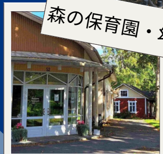
日フィン文化交流