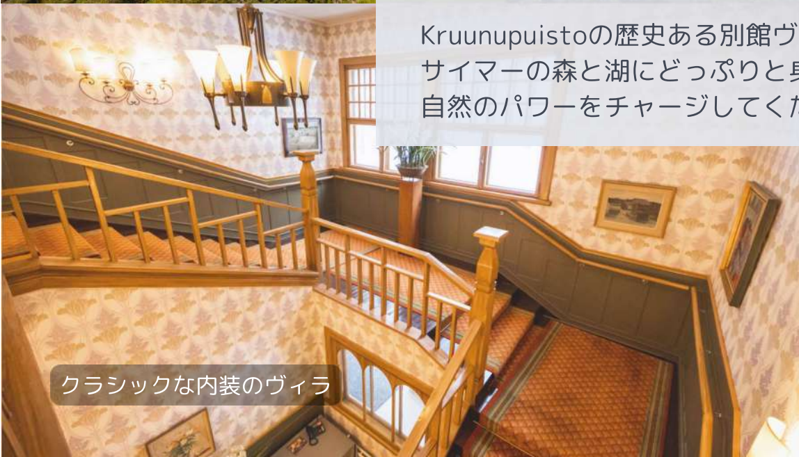
クラシックな内装のヴィラ

Kruunupuistoの歴史ある別館ヴィラと周囲の森を貸切ります。 サイマーの森と湖にどっぷりと身を置き、 自然のパワーをチャージしてください。