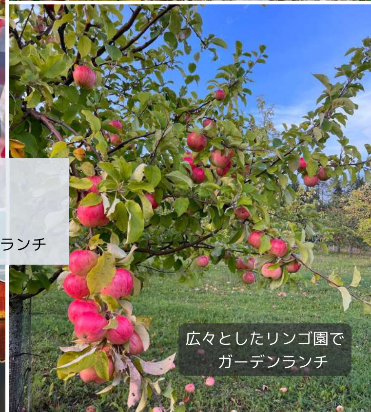
広々としたリンゴ園で ガーデンランチ