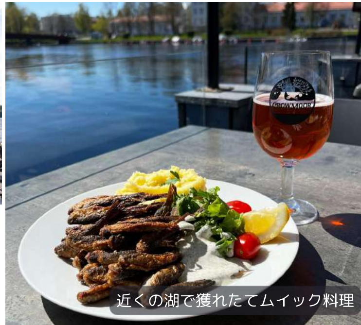
近くの湖で獲れたてムイック料理