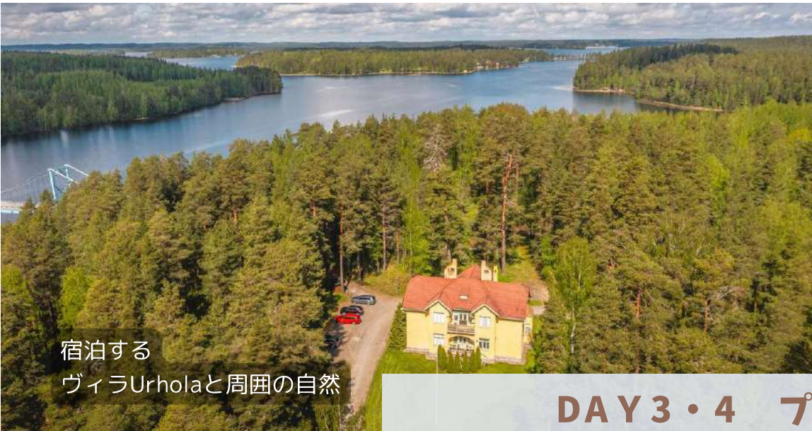
宿泊する ヴィラUrholaと周囲の自然