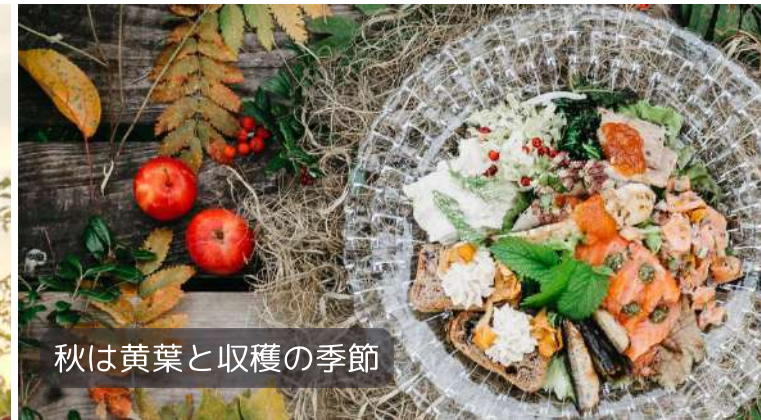
秋は黄葉と収穫の季節