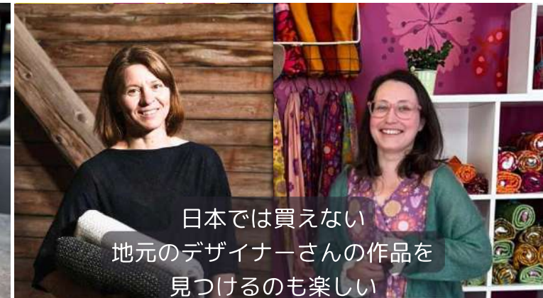
日本では買えない 地元のデザイナーさんの作品を 見つけるのも楽しい