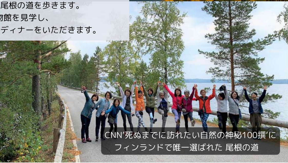
CNN'死ぬまでに訪れたい自然の神秘100撰'に フィンランドで唯一選ばれた 尾根の道