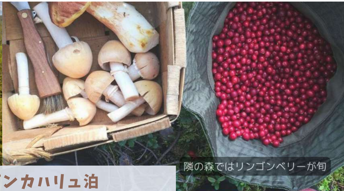
隣の森ではリンゴンベリーが旬