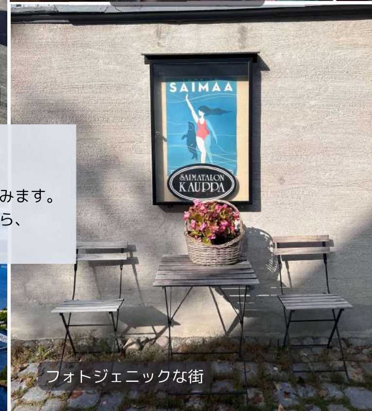
フォトジェニックな街