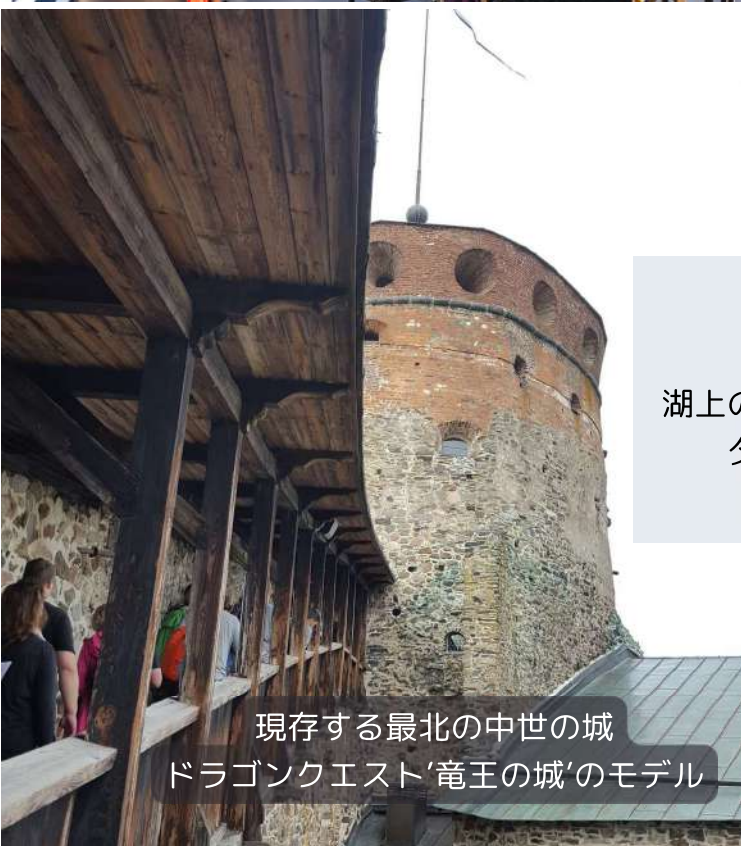
現存する最北の中世の城 ドラゴンクエスト'竜王の城'のモデル

DAY 2 サヴォンリンナ 午後は、現地の在住の日本人ガイドの案内で、湖上の要塞オラヴィ城見学、湖クルーズ、買い物を楽しみます。夕食は、地元で獲れたてのムイックをいただきながら、日本人ガイドとの交流を楽しみます。