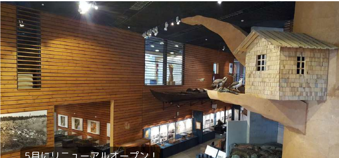
5月にリニューアルオープン！ Lusto森林博物館