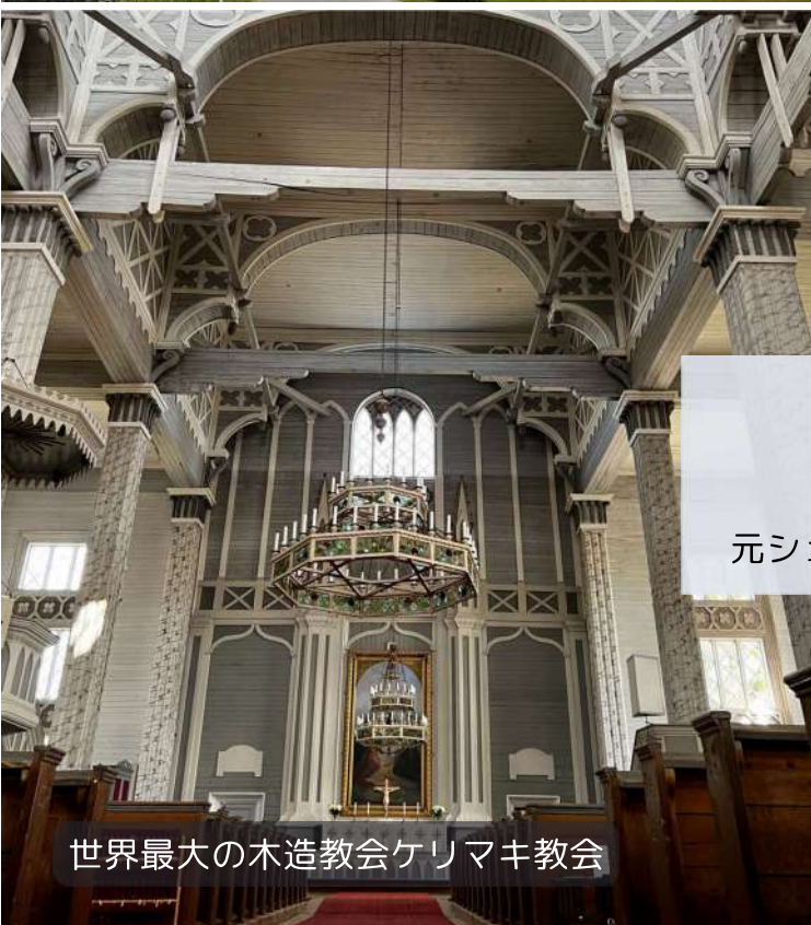
世界最大の木造教会ケリマキ教会