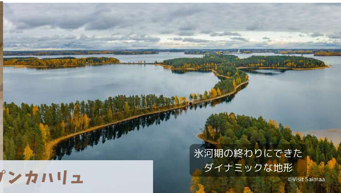
氷河期の終わりにできた ダイナミックな地形