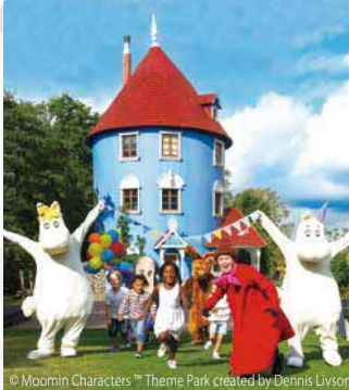
© Moomin Characters.™ Theme Park created by Dennis Livson

フィンランドで一番大きな製菓メーカー、「ファッツェル社」のチョコレート工場では、ヴァーチャル工場見学やチョコレート食べ放題が楽しめます。ファクトリーショップにはお買得のお菓子がたくさん、お友だちへのおみやげもばっちりですね!親子でスイーツ作り体験を楽しみます。