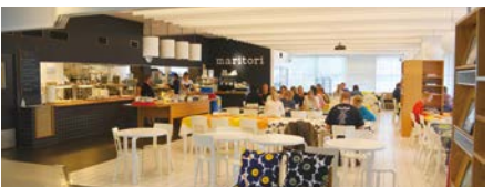
マリメッコファクトリー社員食堂