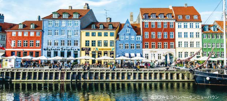
カラフルなコペンハーゲンニューハウン