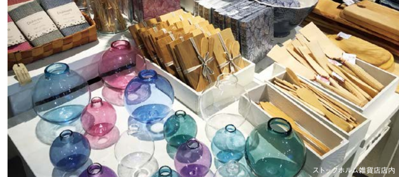
ストックホルム雑貨店店内