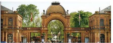
チボリ公園入り口