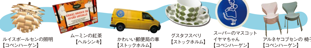
ルイスホールセンの照明 【コペンハーゲン】