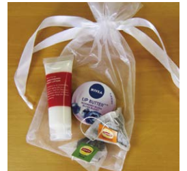
ささやかな「ご褒美プレゼント」