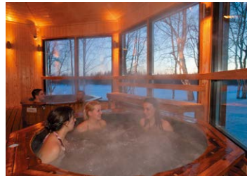
スパ(イヴァロホテル)