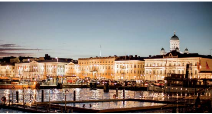
Allas Sea Pool

ヘルシンキ中心部、マーケットスクエアすぐにごできた新施設。ヘルシンキ大聖堂やウスペンスキー寺院などを眺めながらサウナ&海水水泳が楽しめます。