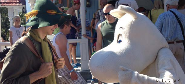
ムーミンワールド