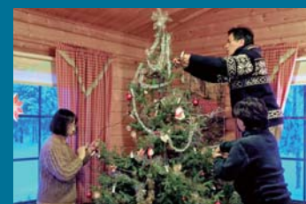
クリスマスツリー飾り付け【Aコース】(イメージ)