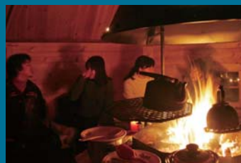
トナカイカレーパーティー【各コース共通】(イメージ)

※上記のスケジュールは現地事情や荒天などの理由により変更となる場合がございます。 ※乗継便は最速便とは限りません。ヘルシンキでの乗継時間に余裕がある場合、ご希望の方には空港～ヘルシンキ市内間のバスチケットを無料で差し上げますので、ヘルシンキで自由行動をお楽しみください。 ※乗継便は同グループでも参加者により便名が異なる場合がございます。 ※航空機の座席指定は成田⇄ヘルシンキ区間のみ有料にて指定可能です。詳しくはお問い合わせください。