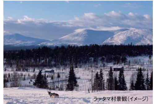
ラタマ村景観(イメージ)