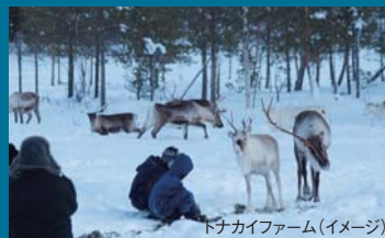
トナカイファーム(イメージ)