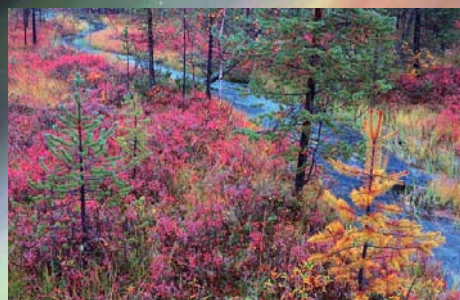
ルスカ・イナリ (イメージ)