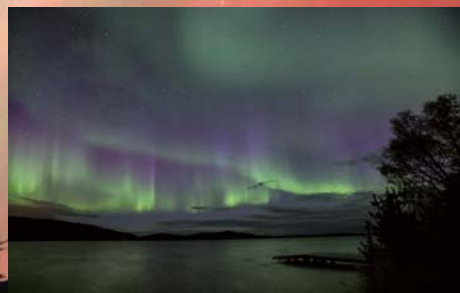
オーロラ・ウコンヤルヴィ (イメージ)