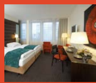
コペンハーゲン(インペリアル)