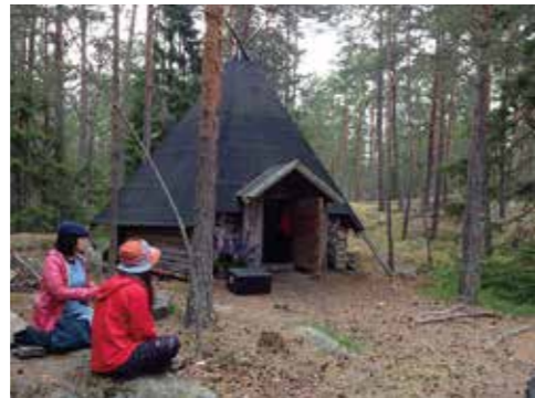
▲フィンランドの森で、ムーミンの世界を感じる体験を