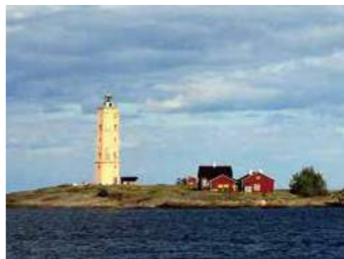
▲「ムーミンババ海へ行く」の舞台といわれるソーダーシャールの灯台