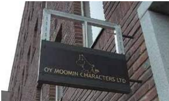
▼ムーミン・キャラクターズ社オフィス

ムーミン・キャラクターズ社は世界的な人気者であるムーミンを守り支えている会社。普段、一般の方は立ち入ることのないこの場所に皆様を特別ご招待！ムーミングッズが誕生した1950年代からの貴重なものから、現在販売されているものまで、数々のムーミングッズが展示されているオフィスは圧巻です。